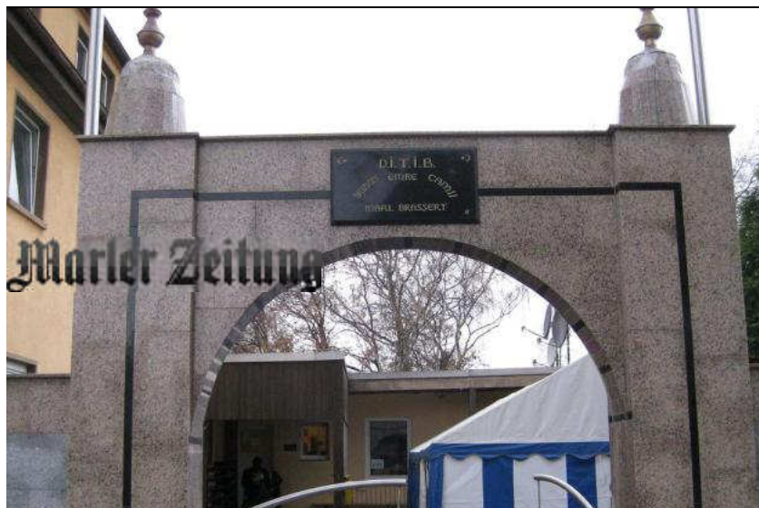
Die Yunus-Emre-Moschee an der Haardstraße in Brassert platz aus allen Nähten. Die Gemeinde suchte händeringend nach einer Möglichkeit zum Neubau. Jetzt soll er an der Sickingmühler Straße entstehen.

Erstellt: 16. Dezember 2014, 11:26 Uhr Aktualisiert: 16. Dezember 2014, 11:26 Uhr